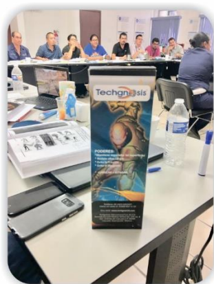
Conoce a Lubrیمان el Héroe de la Liga de la Confiabilidad Techgnosis