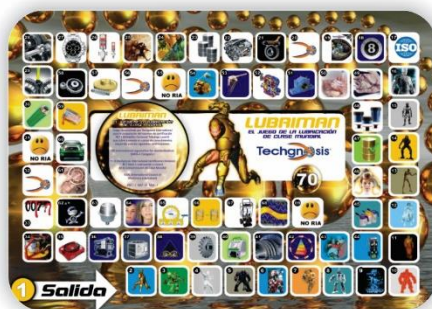
Juego de Certificación Lubrیمان