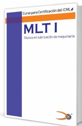
Libro para Certificación MLT I